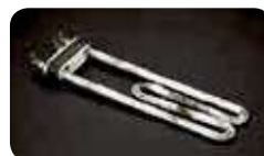
Defekte Elemente / Résistance endommagée / Resistenza danneggiata

Entfernt unangenehme Gerüche Supprime les mauvaises odeurs Rimuove i cattivi odori