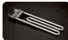
Saubere Elemente / Résistance propre / Resistenza pulita